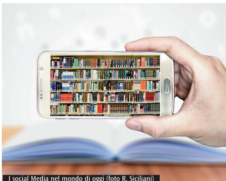
I social Media nel mondo di oggi

troverse, TikTok è pienamente figlio della nostra epoca: sempre in continuo sviluppo, viene utilizzato dai più giovani sia come luogo di intrattenimento sia per dar voce alla loro creatività. Come? Tramite contenuti video della durata di una manciata di secondi in cui ogni "creator" utilizza un proprio, unico e distintivo "tone of voice". Ed è proprio qui che TikTok si implementa, si contamina e dà spazio anche a video di taglio educativo e didattico. Certamente ci sono molti punti critici, propri del modo in cui i contenuti vengono prodotti e fatti circolare nei social (pensiamo al lato più problematico e al tema dell'età nell'accesso che non può essere separato dalle competenze media-educative necessarie). La cronaca purtroppo ci ha testimoniato come TikTok sia stato anche lo spazio di contenuti pericolosi che, imitati, hanno avuto epiloghi drammatici. E qui un richiamo all'accompagnamento degli adulti sulle piattaforme digitali sia fondamentale. In punta di piedi, vorremmo però riflettere su come, questa piattaforma, possa essere invece utilizzata per promuovere "spazi di formazione". Ma allora, quali sono gli spazi di lavoro in termini media-educativi? Partiamo da una prima analisi dell'hashtag #imparaconTikTok. Questo categorizza la diffusione dei post educativo-didattici che spaziano dalla letteratura